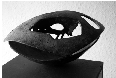
Wolfgang Ueberhorst, SKULPTUR Nr. 3 (2001) sGawagai%(Bronze)

Michael Denhoff SKULPTUR II op. 76, 2 (1999) . ca. 8q