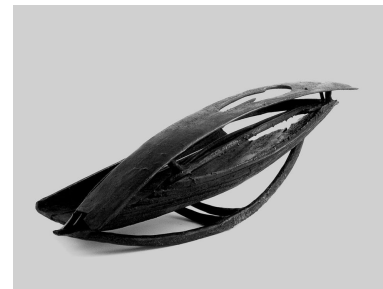
Wolfgang Ueberhorst, SKULPTUR Nr. 6 (2007) sBarcarola%(Bronze)

Michael Denhoff SKULPTUR V op. 76, 5 (2005) . ca. 11q