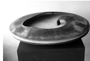
Wolfgang Ueberhorst, SKULPTUR Nr. 4 (2003) sNascita di unqidea%(Bronze & Alabaster)

Michael Denhoff SKULPTUR III op. 76, 3 (2001) . ca. 15q